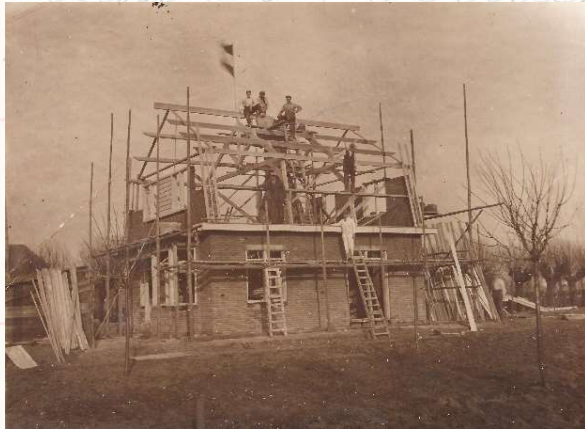
Afb. 1. Nijburgse straat 55 Randwijk in aanbouw.