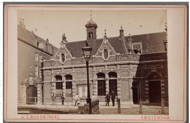
Afb. 2. Zicht op het Binnengasthuis, Oudezijds Voorburgwal 235, 1875-1883.