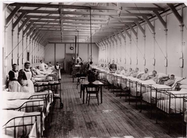
Afb. 3. Mannenzaal ca. 1897.

Van privacy is in 1882 nog geen sprake zoals op de bijgaande foto van de mannenzaal uit 1897 te zien is.